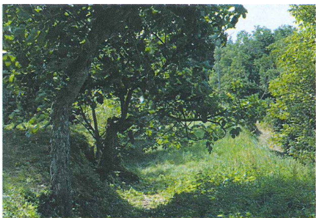
Tutela dell'ambiente Preservation of the environment Defensa del medio ambiente Umweltschutz

El Centro del Hombre nació como un centro de armonía internacional, en donde personas de diferente cultura, nacionalidad o religión, pueden convivir en armonía, con el fin de desarrollar sus mejores cualidades, para convertirse en hombres completos, capaces de representar una humanidad nueva y feliz en esta época plagada de conflictos. Para lograr este objetivo, el Centro del Hombre promueve el servicio al género humano, el servicio a la naturaleza y el ecumenismo auténtico, todo esto sostenido por un renacimiento interior del ser humano.