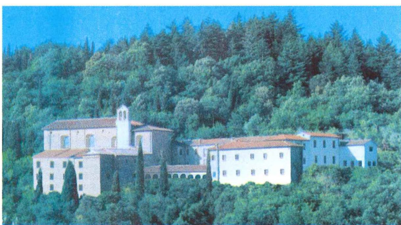
La Sede di Arezzo del Centro dell’Uomo Man Center’s Seat at Arezzo, Italy Sede de Arezzo, (Italia), del Centro del Hombre Der Sitz des Zentrums des Menschen in Arezzo, Italien

Il Centro dell’Uomo è sorto come un centro di armonia internazionale, dove persone di differenti culture, nazionalità, religioni, possano convivere in armonia al fine di sviluppare le proprie qualità migliori per diventare degli uomini completi, capaci di fornire un esempio di un’umanità nuova e felice in quest’epoca dilaniata di conflitti. Per realizzare tale finalità, il Centro dell’Uomo promuove il servizio verso l’uomo, il servizio verso la terra e un ecumenismo autentico, sorretti da una rinascita interiore dell’essere umano.