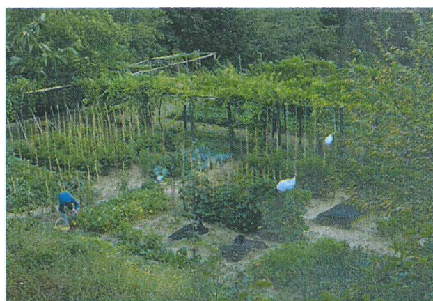
Colture biologiche Organic cultivation Cultivos biológicos Biologische Kulturen